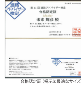
合格認定証 (掲示に最適なサイズ)