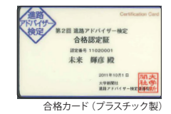
合格カード (プラスチック製)

2020年4月中旬に全受験者へ結果票を送付します。会場受験の合格者には、 合格認定証 を同封します(在宅受験の場合、合格認定証は発行しません)。さらに、会場受験の合格者には、希望により有料で名刺大の 合格カード を作成します。 詳細は、結果通知時にお知らせします。