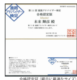
合格認定証 (掲示に最適なサイズ)