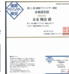
合格カード (プラスチック製)

2026年11月中旬、全受検者へ結果票を送付します。会場受検の合格者には、合格認定証を同封します(在宅受検の場合、合格認定証は発行しません。送付日は本検定Webサイトでお知らせします)。また、会場受検の合格者には、ご希望により有料で名刺大の合格カードを作成します。